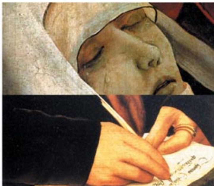
Bild oben: Matthias Grünewald, Detail aus dem Isenheimer Altar (Die Kreuzigung Christi), um 1512, 1616 Bild unten: Hans Holbein d.J., Detail aus dem Portrat von Thomas Godtschalck und seinem Sohn John, 1528

Eine Möglichkeit und Chance, frühzeitig für die Autonomie bis zum Lebensende vorzusorgen bietet das Abfassen einer Patientenverfügung, Vorsorgevollmacht und Betreuungsverfügung sind darüber hinaus wichtige Dokumente zur Vermittlung des mutmaßlichen Patientenwillens. Gerade Tumorkrankheiten in fortgeschrittenen Stadien sollten bestrebt sein, diese Schriftstücke zu erstellen. Die betroffenen Patienten sollten daher über ihre Krankheit und Prognose informiert sein. In einer Befragung wollten wir hierzu Informationen über die Versorgungsrealität im Alltag erhalten.